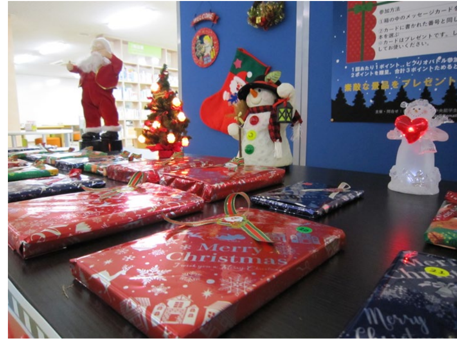
令和3年：クリスマス企画