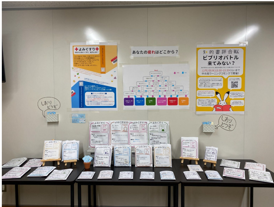
令和2年：よみぐすり

ビブリオバトル開催に当たって景品のある附随企画を実施 （ビブリオバトルと一緒に参加することでポイント獲得）。 条件：①利用者のアクション→②ポイント付与と景品。